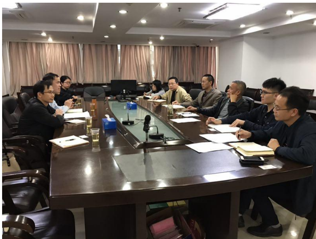
赴广东工程建设监理有限公司调研

3月5日建筑工程技术专业前往广东工程建设监理有限公司开展专业调研，校企双方对工程监理行业发展和人才需求等事宜展开讨论，重点落实了2019级现代学徒制人才联合培养工作中有关人才培养方案细化、企业用工合同审核、企业课程授课计划安排、招考组织和面试等事宜。期间同时看望了我校在该公司实习的学生，了解他们的工作和生活情况，反映良好。