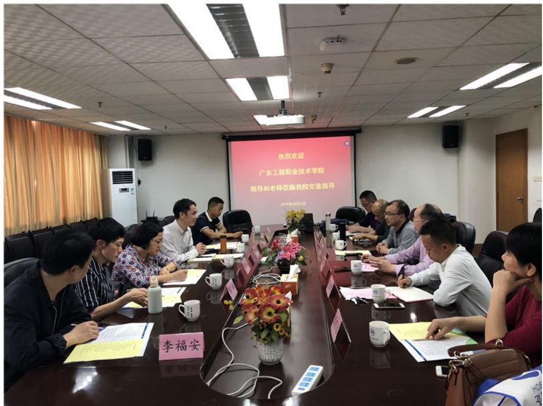
赴广东水利电力职业技术学院学习交流

毕业设计和顶岗实习组织等方面展开了深入的交流学习。期间参观了建筑与环境系的建筑设备综合实训室、建筑设备工程技术专业技能考证点、BIM 工作室、建筑设计工作室等。